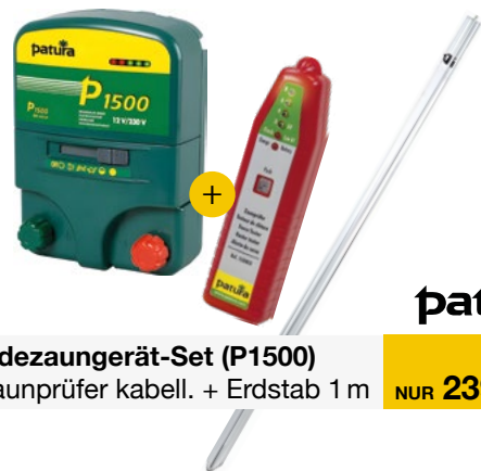
Weidezaungerät-Set (P1500) + Zaunprüfer kabell. + Erdstab 1m