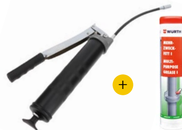
Set Fettpresse inkl. Fettkartusche Fettpresse (246433) + Fett (0893 8701)